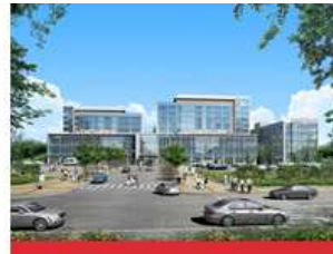
医学校区(大邱北区)