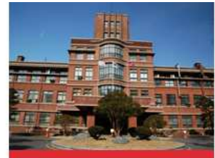
医学校区(大邱中区)